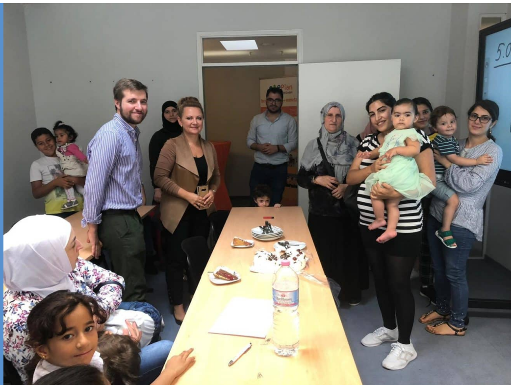
Informationsveranstaltung zum Start der Frauenkurse in Halle

In Magdeburg bereiten sich währenddessen unsere SchülerInnen auf den Test „Leben in Deutschland“ am 5. September vor. Fleißig werden Übungsklausuren zu 310 Fragen aus Politik, Geschichte und Alltagskultur geschrieben. Natürlich wird auch abseits von Tests gelernt, z.B. mit Rollenspielen zum Thema Wahlen. Viel Erfolg!