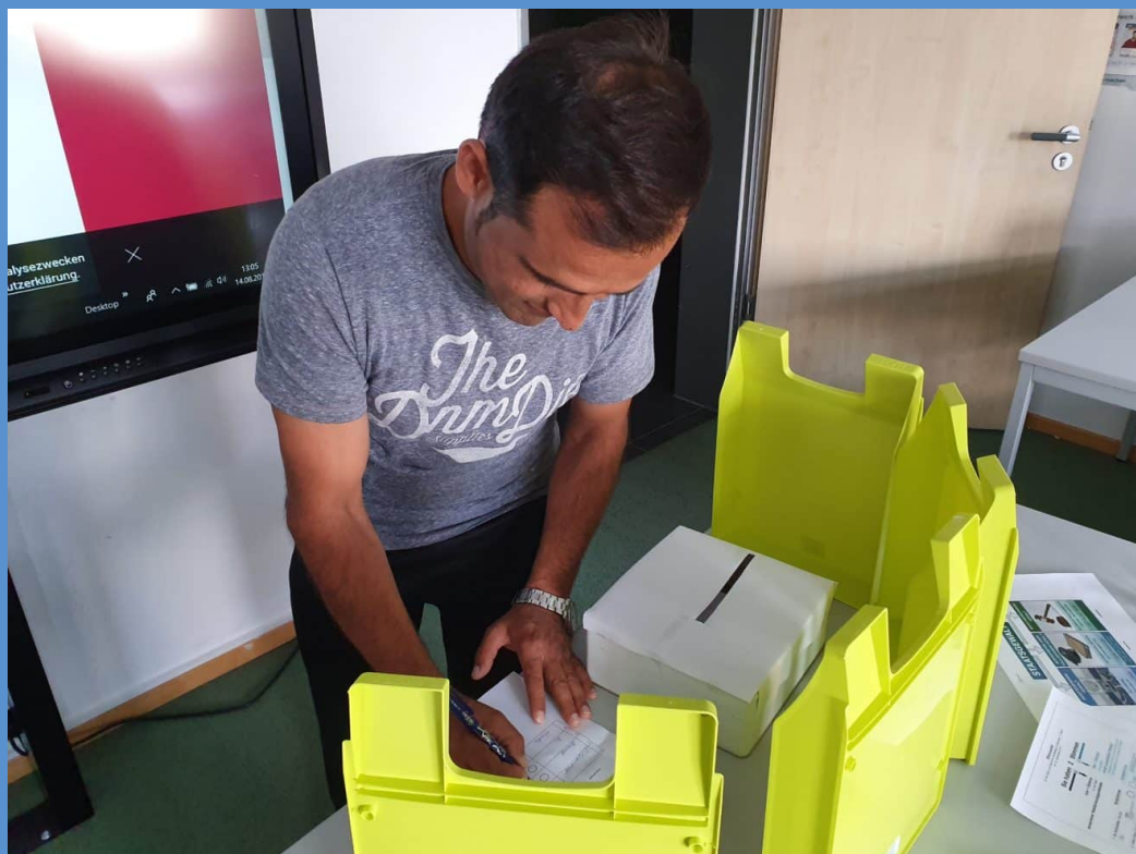
TN des Orientierungskurses in der selbstgebauten "Wahlkabine"

In Magdeburg bereiten sich währenddessen unsere SchülerInnen auf den Test „Leben in Deutschland“ am 5. September vor. Fleißig werden Übungsklausuren zu 310 Fragen aus Politik, Geschichte und Alltagskultur geschrieben. Natürlich wird auch abseits von Tests gelernt, z.B. mit Rollenspielen zum Thema Wahlen. Viel Erfolg!