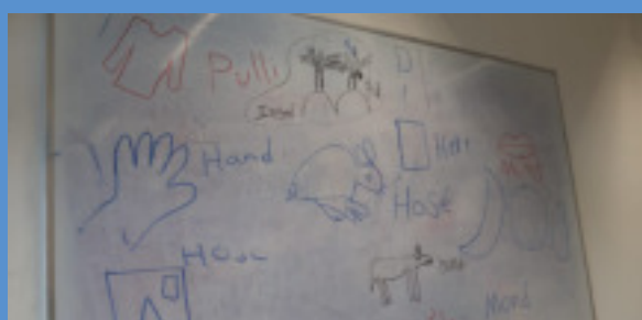
Tafelbild aus dem Alpha-Unterricht