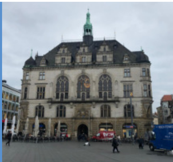
Stadthaus Halle (Saale)

Alphabetisierungskurse bilden auch den aktuellen Schwerpunkt unserer Integrationsarbeit. Neben regulären Kursen steigt die Nachfrage des Schriftspracherwerbs durch MigrantInnen, die weder im Deutschen noch in ihrer Muttersprache lesen und schreiben gelernt haben. Der Unterricht dieser Zielgruppe gestaltet sich entsprechend herausfordernd, da auch oft geringe Sprachkenntnisse vorliegen. Entsprechend niedrigschwellig kann man sich den Unterricht ähnlich der Grundschule vorstellen.